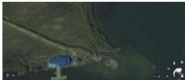
Gambar 1. Lokasi penelitian di Desa Waq Toweren

Penelitian ini dilaksanakan di Desa Waq Toweren, Kecamatan Lut Tawar, Kabupaten Aceh Tengah. Kabupaten Aceh Tengah termasuk bagian tengah Pulau Sumatera yang merupakan bagian dari pegunungan Bukit Barisan, dengan ibukota di Takengon. Secara astronomis Kabupaten Aceh Tengah terletak antara 4° 10' 33" - 5° 57' 50" LU dan di antara 95° 15' 40" - 90° 20' 25" BT. Luas wilayahnya mencapai 4.318,39 Km 2 yang pada umumnya berupa dataran rendah, dan bagian tengah wilayahnya sebagian berupa perbukitan (BPS, 2016) Berikut peta lokasi penelitian: