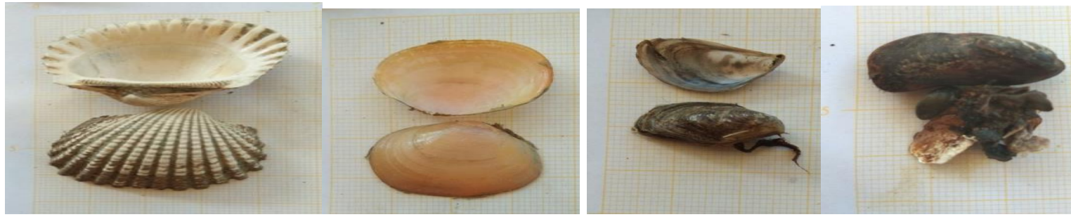
Anadara granosa Gari elongata Mytilopsis leucopheata Geukensia demissa