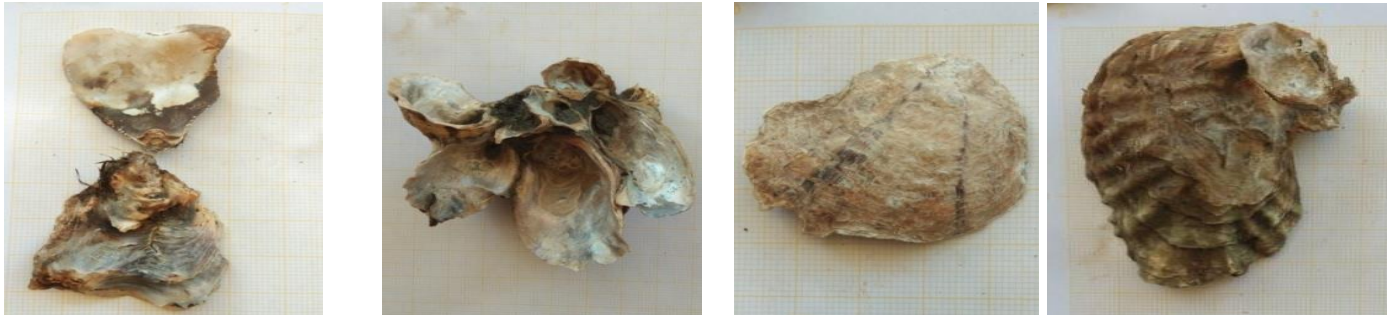
Ostrea sp Saccostrea cucullata Ostrea edulis Crassostrea gigas