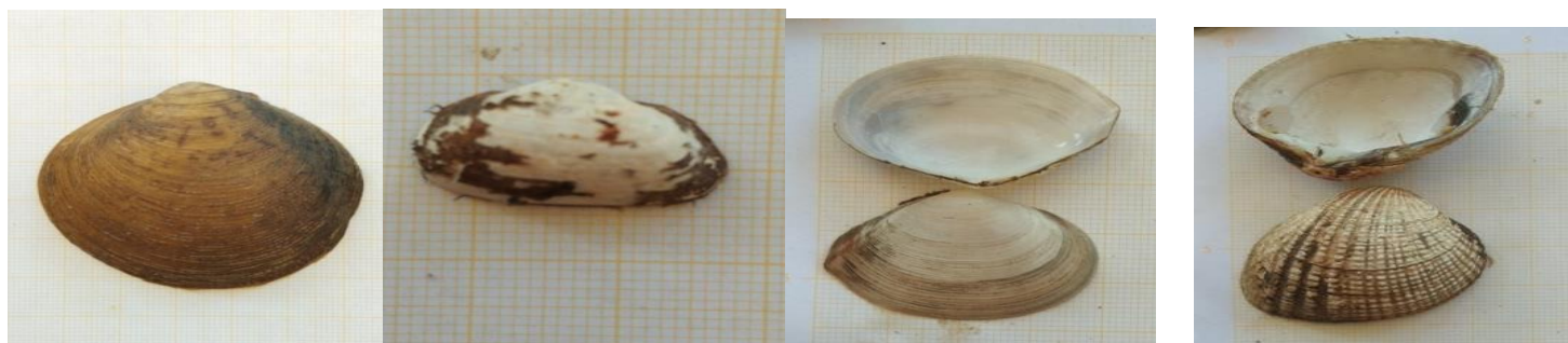
Polymesoda erosa Lutraria lutraria Tellina palatum Gafrarium tumidum