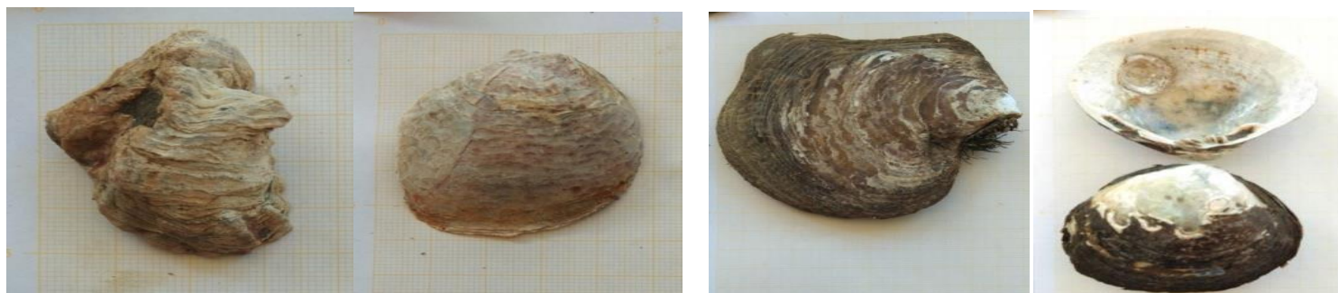
Crassostrea virginica Crassostrea iredalei Isognomon alatus Polymesoda expansa