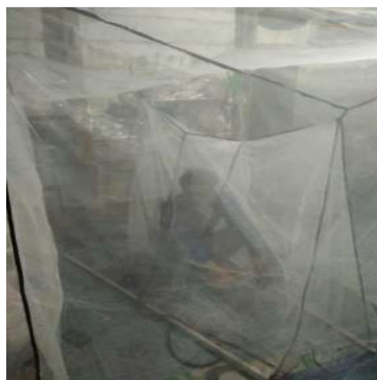
Gambar 1. Metode human landing collection hasil modifikasi

Data dianalisis secara deskriptif, diinterpretasikan dan disajikan dalam bentuk Tabel/Grafik.