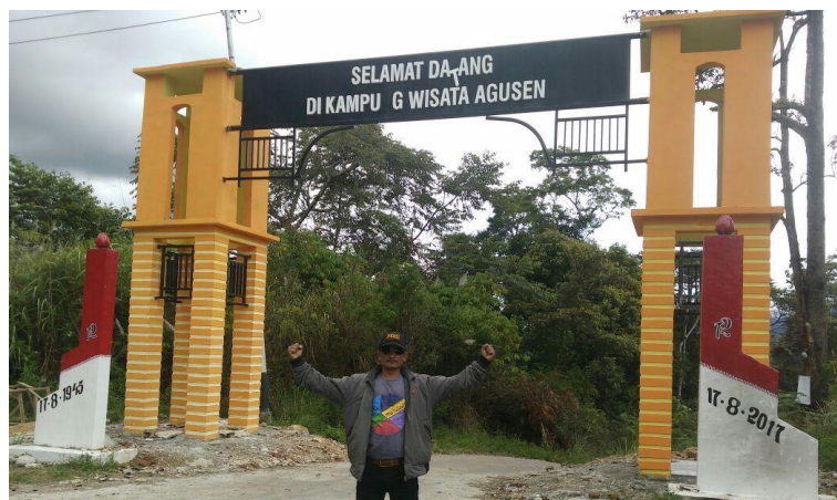
Gambar 1. Simpang jalan menuju wisata Agusen Gampong Agusen Kecamatan Blangkejeren Kabupaten Gayo Lues.

Berdasarkan data menunjukan bahwa keberadaa objek wisata Agusen merupakan salah satu objek wisata yang memiliki pengunjung paling banyak yaitu sebesar 1000 pada bulan Agustus tahun 2016.