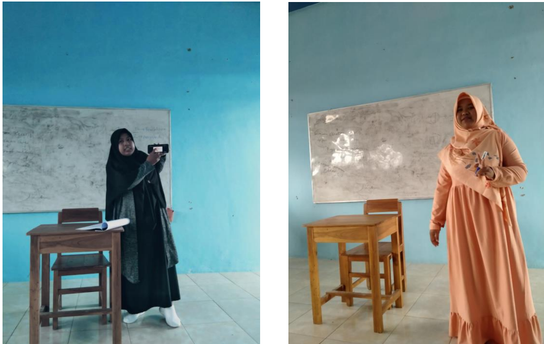
Gambar 4. Simulasi Pembelajaran

must be literate in technology as a new concept for professional performance towards quality learning 13