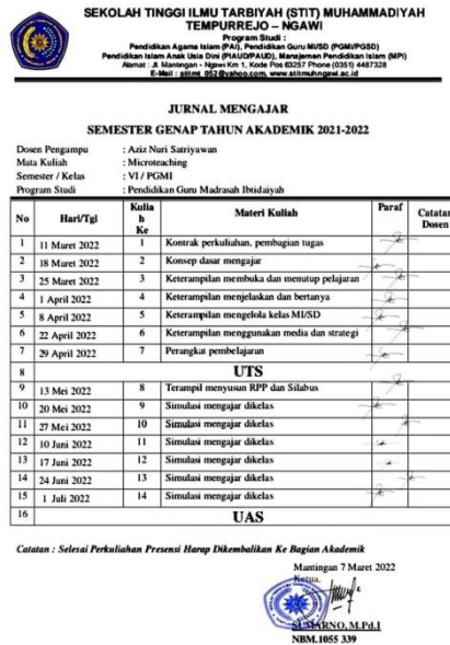
Gambar 1. Jurnal Mengajar

successors are critical thinking, collaboration, decision making, and good communication skills 11 . Berikut dipaparkan terkait jurnal mengajar :