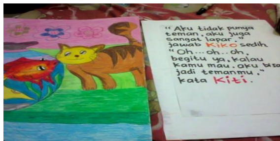
Gambar 3. Penggabungan antara gambar cerita dengan naskah

Ketiga , mulai tempelkan semua cerita dengan naskah cerita yang dibuat secara sederhana.