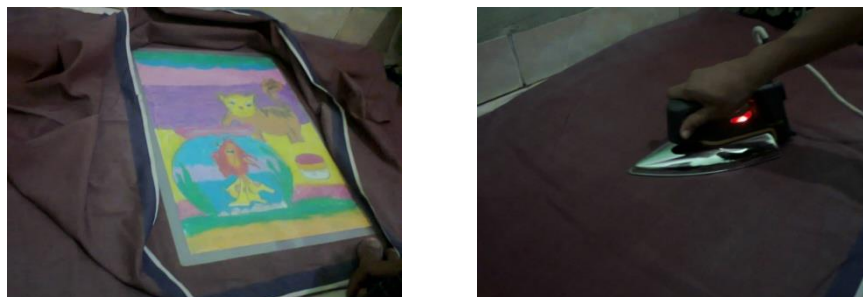
Gambar 4. Proses laminating dari big book

Keempat , ambilah plastik untuk melapisi gambar agar awet kemudian disetrika dengan dilapisi kain untuk melaminating big book .