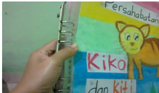
Gambar 5. Menyatukan semua dari isi big book

Kelima , bagian akhir dari pembuatan media big book ini adalah gabungkan semua gambar dengan urut dengan menggunakan spiral dari binder bekas. Dan jadilah big book sederhana.