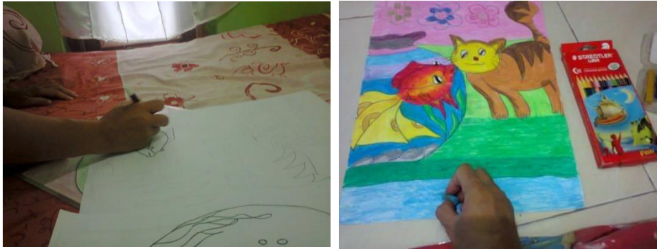
Gambar 2, menggambar dan mewarnai big book

barulah gambar di warnai dengan warna yang menarik, yang tujuannya menarik minat membaca pada anak usia dini.