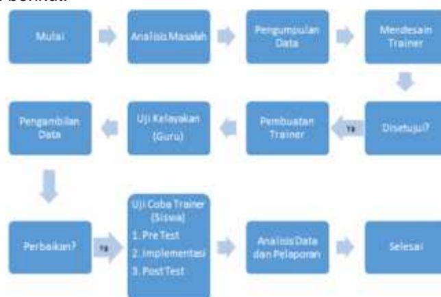
Gambar 1. Tahap penelitian Metode Research and Development (R & D)

Permasalahan yang akan dibahas menggunakan metode penelitian dan pengembangan ( Research and Development ). Research and Development (R&D) merupakan metode yang digunakan untuk menghasilkan produk tertentu, dan menguji keefektifan produk tersebut (Sugiyono, 2013). Lokasi penelitian dilakukan di workshop program keahlian Teknik instalasi tenaga listrik di SMK Negeri 2 Peureulak. Subyek penelitian ini adalah trainer pengontrolan elektromagnetik dan buku petunjuk praktik ( jobsheet ) sebagai media pembelajaran praktik pengontrolan elektromagnetik. Dengan responden 3 guru dan 23 peserta didik program keahlian teknik instalasi tenaga listrik di SMK Negeri 2 Peureulak. Prosedur penelitian dapat dilihat pada diagram berikut: