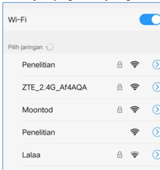
Gambar 6 Ikon gembok pada Wi-Fi