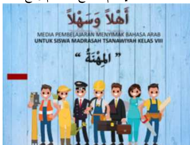
صورة ٦ : بداية البرنامج

(٥) الوسائط المتعددة التفاعلية في تعليم الاستماع باستخدام برنامج Macromedia Flash 8