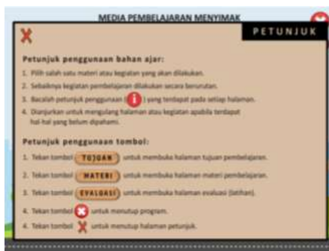
صورة ٨: إشارة استخدام البرامج

في القائمة الأولى تتضمن من الصور المتعلقة بموضوع البرنامج أي المهنة. وفيها الأزرار ليظهر القوائم المتعددة وهي زر الخروج (x) ليغلق البرنامج وزر (i) ليظهر إشارة استخدام البرامج وزر (TUJUAN) ليظهر صفحة الأهداف التعليمية وزر (MATERI) ليفتح قائمة المادة التعليمية وزر (EVALUASI) ليفتح قائمة التقويم. ويتضح هذا عرض إشارة استخدام البرامج فيما يلي: