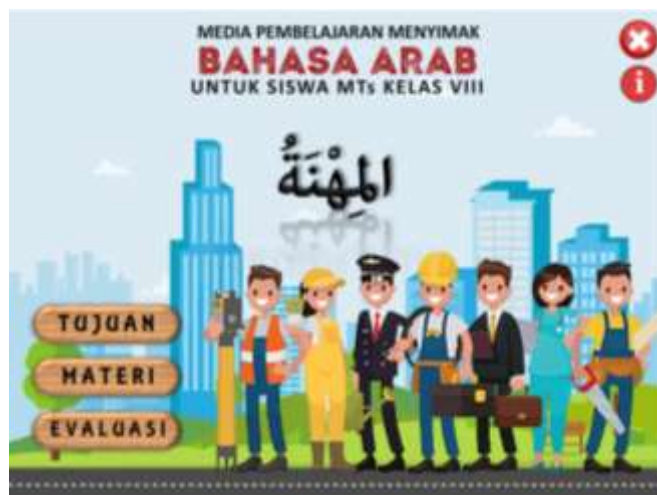
صورة ٧: قائمة الأول

في القائمة الأولى تتضمن من الصور المتعلقة بموضوع البرنامج أي المهنة. وفيها الأزرار ليظهر القوائم المتعددة وهي زر الخروج (x) ليغلق البرنامج وزر (i) ليظهر إشارة استخدام البرامج وزر (TUJUAN) ليظهر صفحة الأهداف التعليمية وزر (MATERI) ليفتح قائمة المادة التعليمية وزر (EVALUASI) ليفتح قائمة التقويم. ويتضح هذا عرض إشارة استخدام البرامج فيما يلي: