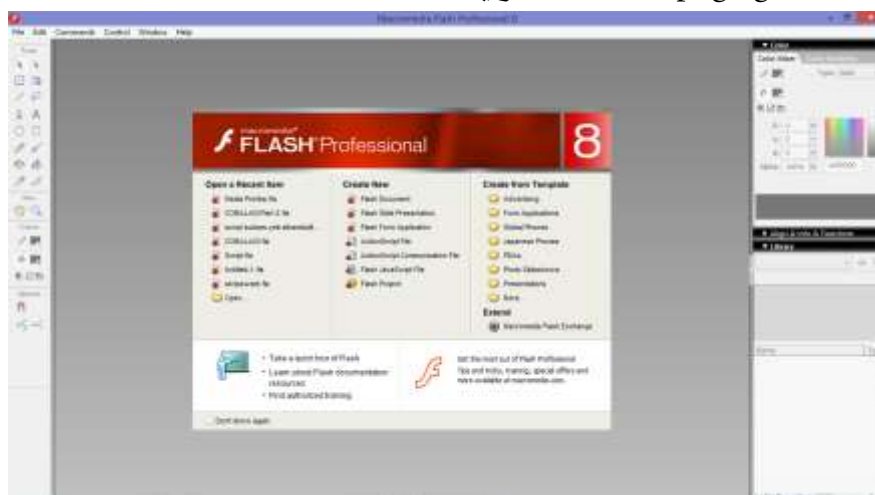
صورة ١ : الصفحة الرئيسية لبرنامج Macromedia Flash 8

بهذا البرنامج يستطيع المصمم أن يصمم الوسائط بسهولة. أما مزايا هذا البرنامج من برنامج آخر فهي من سهولة التعلم للمبتدئين ويمكن المستخدم بسهولة تصميم الرسوم المتحركة وتحويل الإنتاج إلى أنواع متعددة مثل mov., exe., png., gif., html., stw., وغيرها.