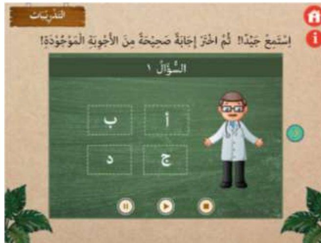
صورة ٤ : الوسائط قبل تقييم الإنتاج

بعد تطوير الإنتاج، فالخطوة الرابعة هي تعديل الإنتاج لتقييم تصميم الإنتاج أو تحكمه. فيستطيع المستخدم استخدام الوسائط المتعددة بعد إحضار الرأي والتعديل من الخبراء المؤهلين. فالتعديل من خبراء اللغة ستستخدم لتنصيب التراكيب اللغوية المستخدمة في تصميم الإنتاج. ثم التعديل من خبراء مجال التصميم ستستخدمه لاصلاح إنتاج التخطيط من جهة الصور والألوان والمواضع المستخدمة. فتصلح الإنتاج مناسبة بتصديق الخبراء المؤهلين، حتى تقلل العيوب والسلبيات فيه.