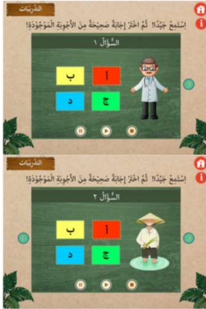
صورة 16 : قائمة التقييم

لتختيم البرنامج، على المستخدم أن يعود إلى القائمة الأولى ثم ضغط زر (x).