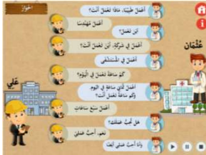
صورة ١٢: المواد الحوار

في هذه المادة تسع المفردات عن المهنة وهي المدرس والفلاح والمهندس والطبيب والبائع والشرطي واللاعب والكناس والطباخ. لكل المفردات صوتية عن المفردات المتعلقة لتركيز التلاميذ على مهارة الاستماع. ولكل مفردات الجمل القصيرة وصوتية لكل الجمل.