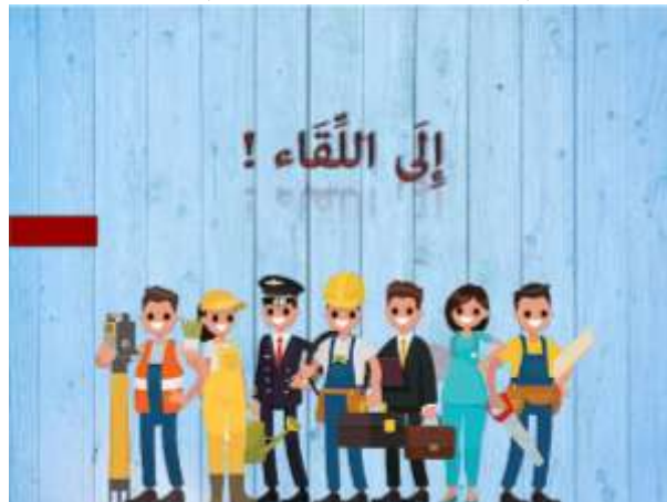
صورة ١٧ : الصفحة النهائية

لتختيم البرنامج، على المستخدم أن يعود إلى القائمة الأولى ثم ضغط زر (x).