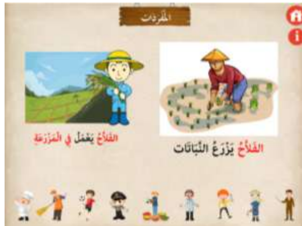
صورة 11 : مادة المفردات

في قائمة المواد الدراسية ٣ القوائم الفرعية أي قائمة المفردات والحوار والتركيب. كل المواد في هذا الوسائط متركزة لتعليم الاستماع. المواد التعليمية بدءاً بالمفردات.