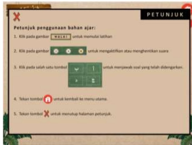
صورة ١٥ : إشارات استخدام صفحة التقييم

في قائمة التقييم لها ١٥ سؤالاً عن المهنة. كل سؤال معروض بالصوتية لتركز التلاميذ على مهارة الاستماع. فلا بد للتلاميذ أن يستمعوا جميع الأسئلة بشكل تأمل كامل غرضاً لإجابتها إجابة صحيحة.