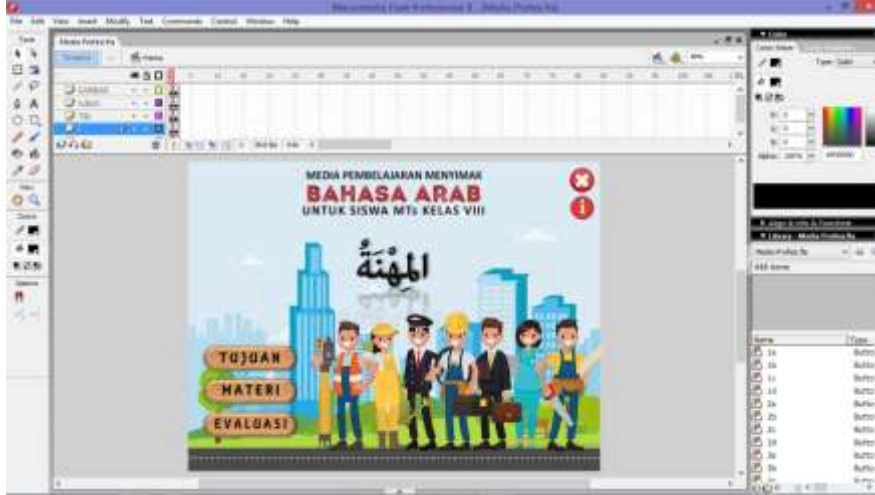
صورة ٣ : معالجة تخطيط الوسائط المتعددة