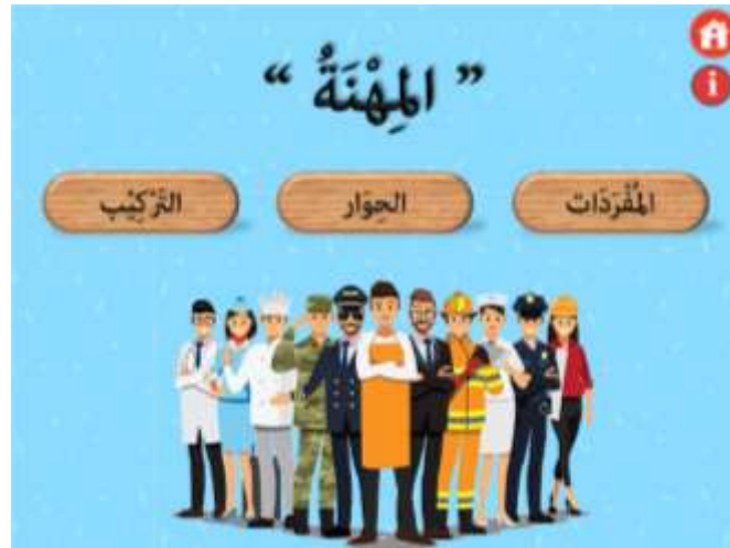
صورة ١٠ : قائمة المواد

في قائمة المواد الدراسية ٣ القوائم الفرعية أي قائمة المفردات والحوار والتركيب. كل المواد في هذا الوسائط متركزة لتعليم الاستماع. المواد التعليمية بدءاً بالمفردات.