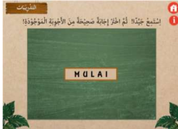
صورة ١٤ : بداية قائمة التقييم

وقائمة النهائية هي قائمة التقييم. فصفحة التقييم تبدأ بهذه الصفحة. فيها ٣ الأزرار: فوقها زر ليعود إلى القائمة الأولى ليظهر إشارات استخدام صفحة التقييم وفي لب الصفحة يبرز الزر لبدء طرح الأسئلة التقييمية.