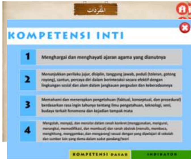
صورة ٩ : صفحة الأهداف التعليمية