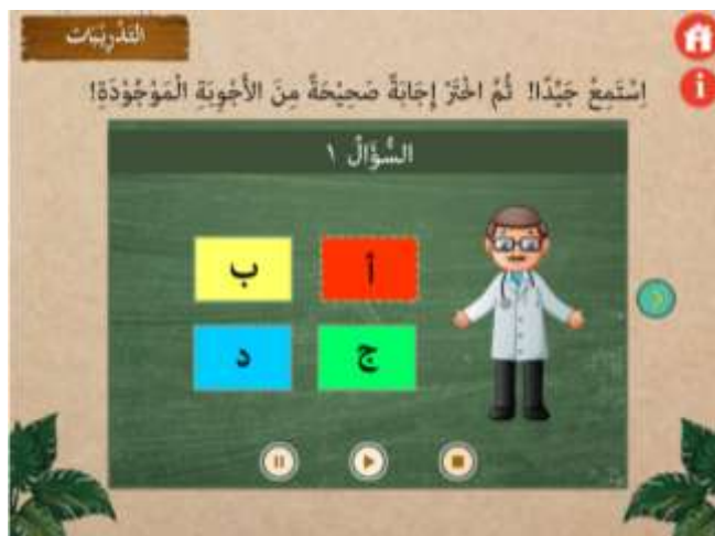
صورة ٥ : الوسائط بعد تقويم الإنتاج

(٥) الوسائط المتعددة التفاعلية في تعليم الاستماع باستخدام برنامج Macromedia Flash 8