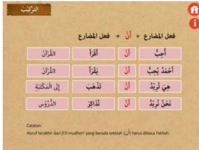
صورة ١٣ : المواد التركيبية