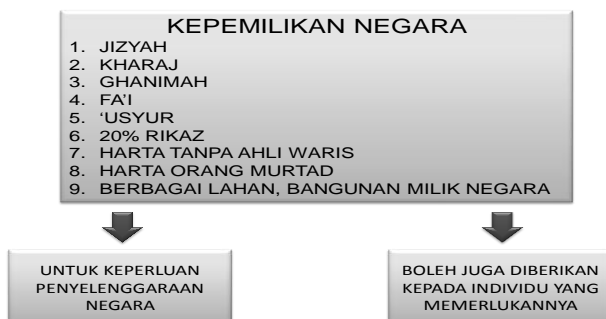
Gambar.7. Skema Kepemilikan Negara

Harta yang masuk kategori milik Negara dapat diberikan kepada individu tertentu sehingga menjadi hak miliknya. Ketentuan ini tentu berbeda dengan ketentuan yang berlaku pada kepemilikan umum. Harta milik umum pada dasarnya tidak dapat diberikan oleh Negara pada individu tertentu, walaupun Negara dapat membolehkan pada orang-orang untuk mengambilnya melalui pengelolaan oleh Negara, yang memungkinkan bagi setiap individu untuk memanfaatkannya.