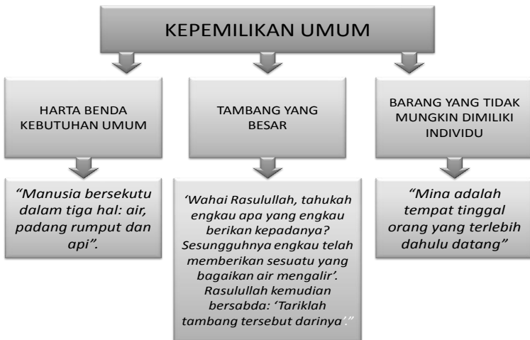
Gambar. 4 Skema Kepemilikan Umum ( Milkiyah ‘Ammah )

Kepemilikan umum adalah ijin Asy-Syari’ kepada suatu komunitas untuk bersama-sama memanfaatkan suatu benda. Benda-benda yang termasuk dalam kategori kepemilikan umum adalah benda-benda yang dinyatakan Asy-Syari’ diperuntukkan bagi suatu komunitas dan mereka saling membutuhkan. Asy-Syari’ melarang benda tersebut hanya dikuasai seorang saja. Untuk lebih jelasnya dapat kita pahami melalui gambar 4. Berikut ini: