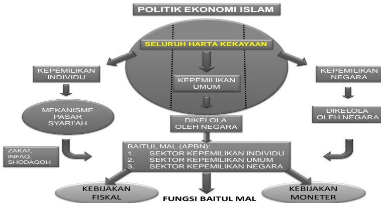
Gambar.3. Politik Ekonomi Islam Madzhab Hamfara

Politik ekonomi Islam Madzhab Hamfara ini penekanan kebijakan fiskal dan kebijakan moneter terfokus kepada pengelolaan kepemilikan Individu, kepemilikan umum dan kepemilikan Negara. Sehingga setiap permasalahan ekonomi bisa diselesaikan dengan baik melalui sektor-sektor tersebut. Peran Baitul Mal sangat penting dalam rangka mengembangkan kepemilikan individu, kepemilikan umum dan kepemilikan Negara, karena merupakan sentral dalam pengelolaan kekayaan tersebut, dan bertanggungjawab dalam melakukan distribusi kekayaan kepada masyarakat.