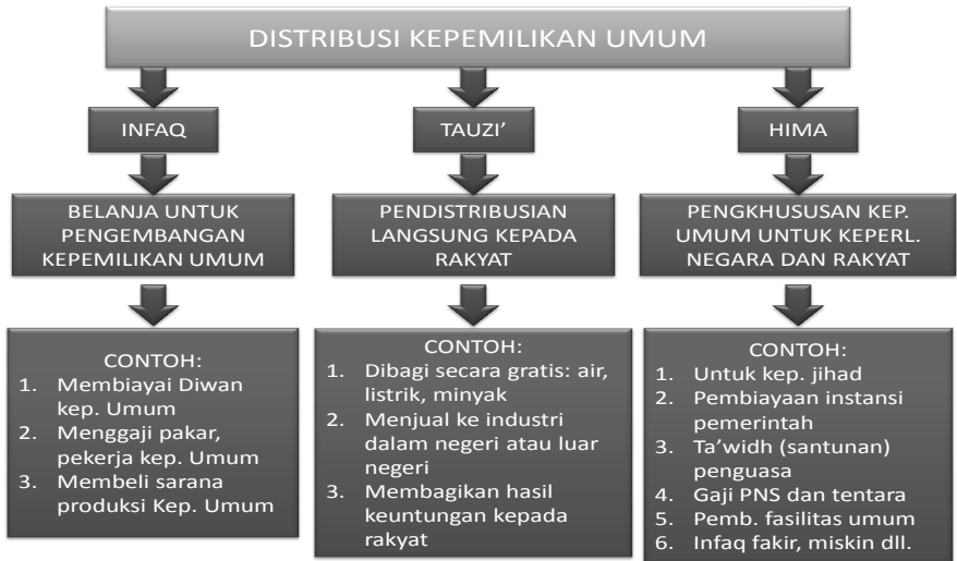
Gambar.6. Skema Distribusi Kepemilikan Umum.

pembiayaan instansi pemerintah, ta'wids (santunan penguasa), gaji PNS (Pegawai Negeri Sipil) dan tentara, pembiayaan fasilitas umum, infaq fakir, miskin, dan lain-lainnya. Untuk lebih jelaskan bisa dilihat pada Gambar.6 tentang Distribusi kekayaan Umum: