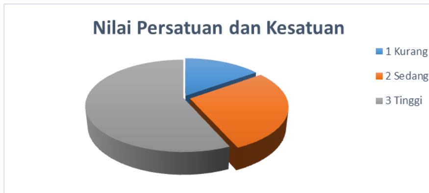
Grafik 1. Hasil Pengukuran Nilai Persatuan dan Kesatuan Aktivis Rohis

sikap Nilai Cinta Tanah Air skor minimal 24, skor maksimal 120. Perolehan masing-masing aspek tersebut dibagi ke dalam tiga tingkatan dengan jumlah interval sama dalam tiap tingkat. Selanjutnya diperoleh gambaran siswa dengan sikap Nilai Persatuan dan Kesatuan kurang, sedang dan tinggi serta sikap Nilai Cinta Tanah Air kurang, sedang dan tinggi. Hasil penelitian sikap Nilai Persatuan dan Kesatuan serta sikap Nilai Cinta Tanah Air aktivis rohis dapat ditampilkan pada grafik 1 dan 2.