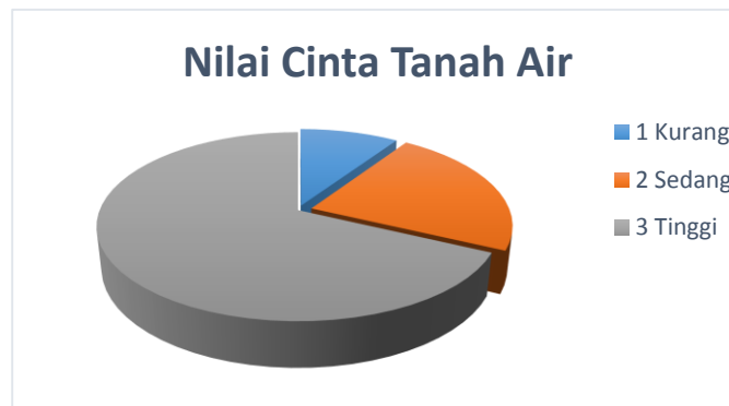
Grafik 2. Hasil Pengukuran Nilai Cinta Tanah Air Aktivis Rohis

Grafik 1 tentang Nilai Persatuan dan Kesatuan menunjukkan bahwa 8 siswa atau 15% aktivis rohis memiliki Nilai Persatuan dan Kesatuan yang kurang, 15 siswa atau 28% aktivis rohis memiliki Nilai Persatuan dan Kesatuan yang sedang serta 30 siswa atau 57% aktivis rohis memiliki Nilai Persatuan dan Kesatuan yang tinggi. Grafik 2 tentang Nilai Cinta Tanah Air menunjukkan bahwa 5 siswa atau 9% aktivis rohis memiliki Nilai Cinta Tanah Air yang kurang, 12 siswa atau 23% aktivis rohis memiliki Nilai Cinta Tanah Air yang sedang serta 36 siswa atau 68% aktivis rohis memiliki Nilai Cinta Tanah Air yang tinggi. Berdasarkan data